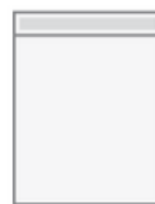
Una bolsa de congelación de plástico transparente de un galón